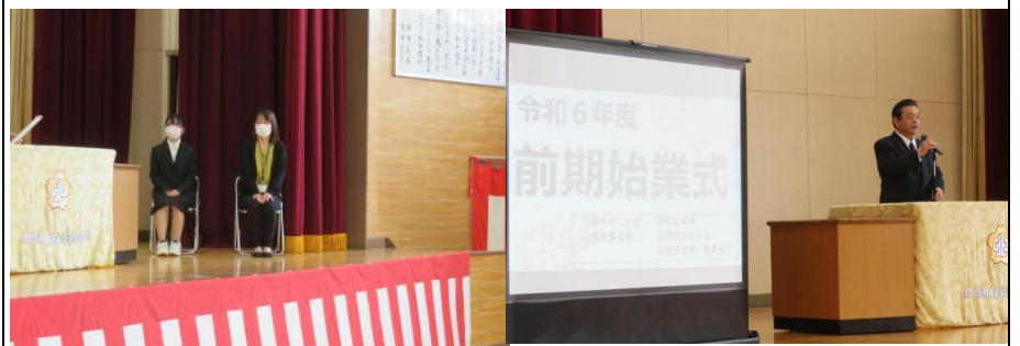
学校長による新学期の式辞の様子

体育館で全児童が集まったの式を行いました。新しい職員を迎え、新年度の始まりです。児童の姿勢や態度も良く新年度にふさわしい式でした。