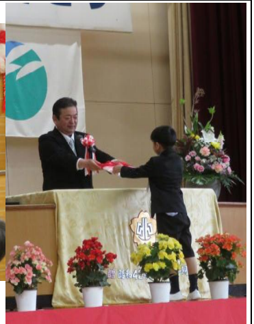
教科書給与で代表児童が受け取っている様子