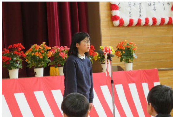
代表児童が歓迎のあいさつを行っている様子

新入生は、緊張した表情を見せながらも、これからの学校生活に対する希望に満ちた表情でした。7名全員が、式の最初から最後までしっかりとした態度で臨むことができ、大変素晴らしかったです。