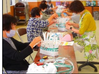
第2回目です。時間が過ぎてもがんばりました。