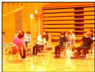
曲に合わせて、体操しています。外はたいへん暑かったのですが、多目的ホールは快適です。