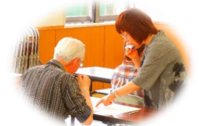
ハーモニカの構造や、ハーモニカ特有の楽譜の読み方から教えていただき、「♪ふるさと」の合奏などをしました。