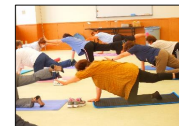
バランスをとりながら手足を伸ばします。手と足が違う動き。できました!ー→