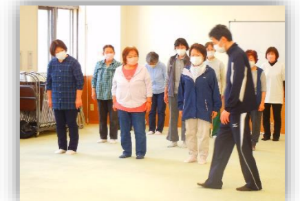
関節の動かし方などを学び、室内を散歩しました。