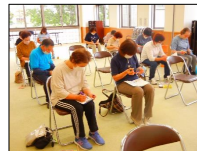
色を塗って、ハサミで切って、「やしろべえ」作。