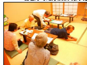
今のお灸は、簡単・安心・煙も出ないのですね。