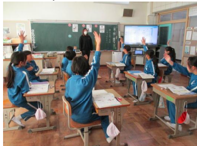
自分の考えを積極的に発表している様子

4つの場面について「公平」か「不公平」かを考え、お互いの考えを比較し、なぜそう考えるか話し合っていました。