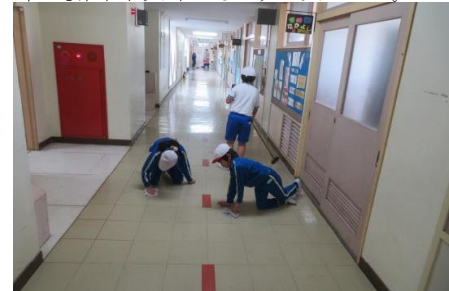
黙々と清掃を行っている様子

年間を通して縦割り班で清掃活動を行っています。それぞれの分担場所で黙々と取り組んでいました。1年生も素早く取り組めるようになりました。