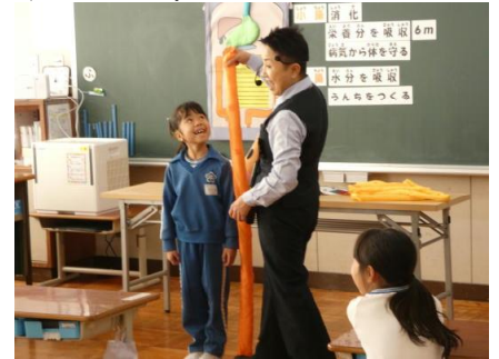
大腸の長さについて確認している様子

「食べ物がおなかのどこを通るか。そしてそれらの名前と働きは何だろう。」という内容で楽しみながら学んでいました。