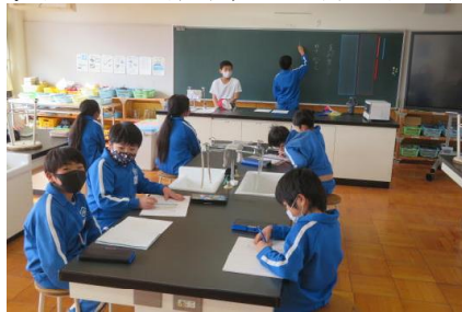
登下校で気付いたことを確認している様子

これまでの登下校についての反省を行い、新登校班における新班長と新副班長の選出を行いました。来月9日から新登校班での登下校を始めます。