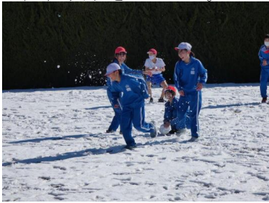
久しぶりに積もった雪の中で遊んでいる様子

降雪対応として2時間遅れ 10:00 登校となりました。登校後、高学年児童は久しぶりに校庭に積もった雪の中で元気に遊んでいました。