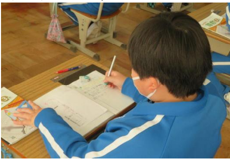
「小数」について考えをノートに記入している様子

「分数」で学んだことをいかして「小数」について考えることができました。意欲的に取り組んでいる様子が見られました。