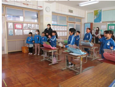
音楽の授業について説明している様子

4月に入学してくる予定の園児達に小学校生活がどのようなものかを1年生が紹介していました。事前準備を行い、堂々と発表できました。