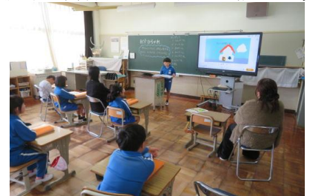
2年生が学習の成果を発表している様子

理科や生活科、総合的な学習の授業で児童はこれまでの成長を見せることができました。参観後学級懇談を行い今年度の振り返りについて共有しました。