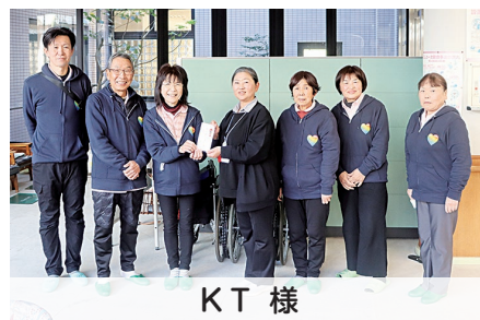
K T 様