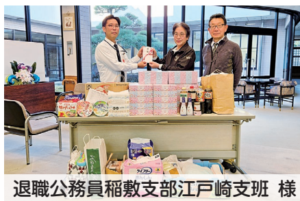
退職公務員稲敷支部江戸崎支班 様