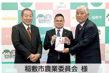
稲敷市農業委員会 様