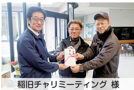
稲旧チャリミーティング 様