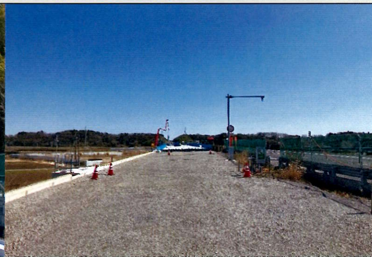
④用排水溝の施工を行っております。