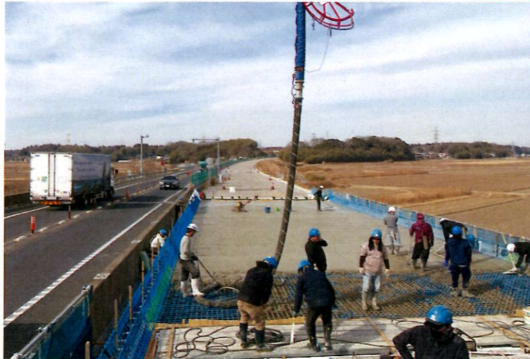
【江戸崎橋】①床版工の施工を行っております。（コンクリート打設中および打設完了後の状況）