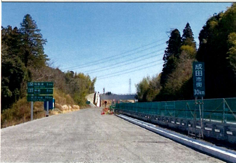
③標識工および用排水溝の施工を行っております。