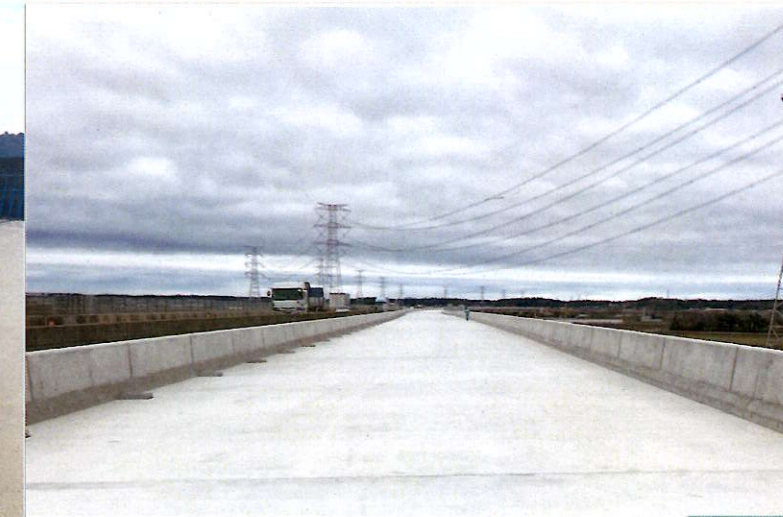
【新利根川橋】②床版の施工が完了しました。