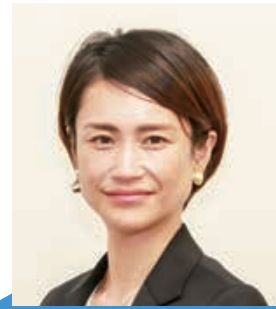
無藤 智恵美 議員