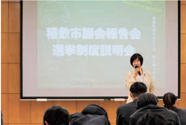
2年生（約120名）の皆さんにご参加いただきました