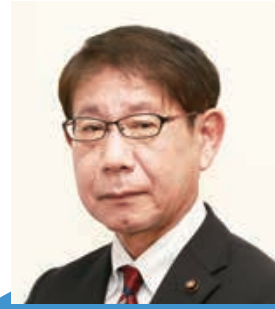
高山 久 議員