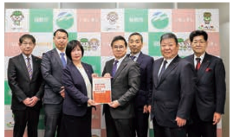
寛市長に報告書を提出