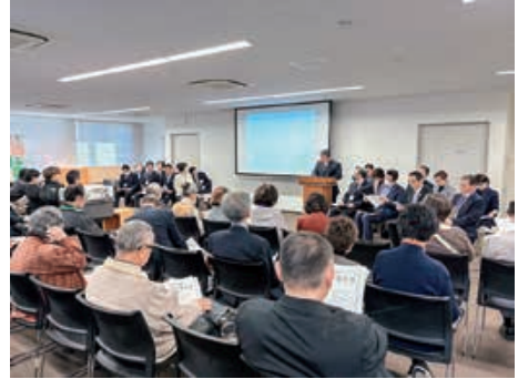
議会報告会の様子