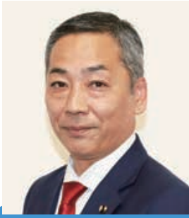
根本 光治 議員