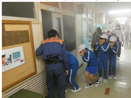
全児童が「煙体験」を行う様子

2校時に避難訓練を行いました。火事を想定したもので、避難経路の確認を中心として行いました。児童は「お、は、し、も、す、し」を守っての行動ができました。避難後、全児童が火災時を想定した「煙体験」を行い、避難する際煙を吸わないようにする大切さの話をいただきました。