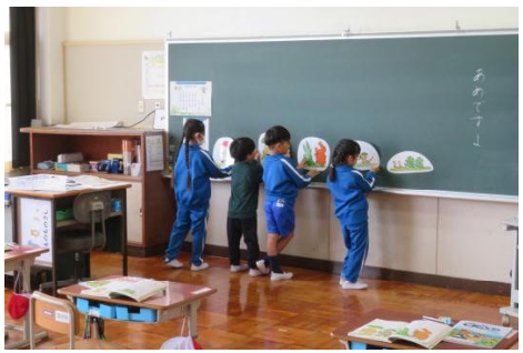
1年生が音読発表の準備を行っている様子

今年度一回目の P T A 授業参観を5校時に行いました。どの学年の児童も意欲的に学習に取り組んでいました。1年生は、音読を大きな声で行っている様子を保護者の皆さんに見せることができました。