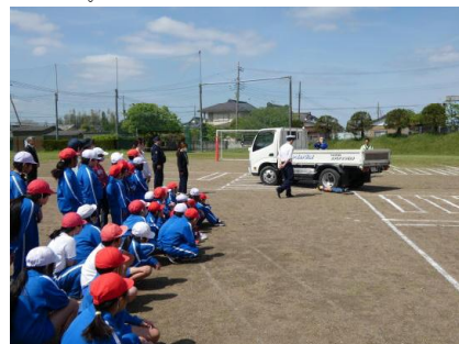
内輪差の危険を見学している様子

稲敷市警察署交通課、伊佐部駐在所の職員さん、交通安全推進員、市役所危機管理課の職員さんを講師にお迎えして交通安全教室を行いました。グラウンドに模擬の横断歩道を設定して、横断歩道を渡るときに気を付けることや、自動車の内輪差について学びました。