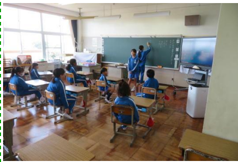
今年度の活動計画について話し合っている様子

北小タイムを使って縦割り班活動の計画を立てました。今年度は4班での活動です。各班で高学年児童が中心となって話し合い、屋外や室内を使ってみんなで楽しめる活動を計画することができました。