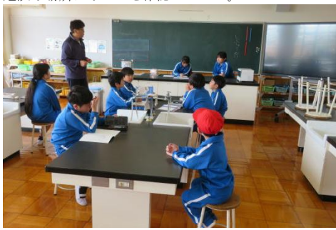
伊佐部地区の児童が通学路の危険箇所を確認している様子

北小タイムで支部集会を行いました。新一年生を加えた登校班での集合時間や集合場所の再確認と1週間の間に気付いたことについて確認を行いました。集合時間については、ちょうどいい時刻に学校に着けるように班ごとに調整しました。また、通学路で危険な場所はないかを確認しました。