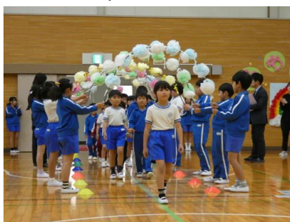
2年生のエスコートで入場している様子

北小タイムに「新入生歓迎集会」を行いました。6年生が中心となって計画、運営を行いました。会の中で「じゃんけん列車」や「船長の命令」等のゲームを取り入れ全校児童が楽しみながら交流することができました。