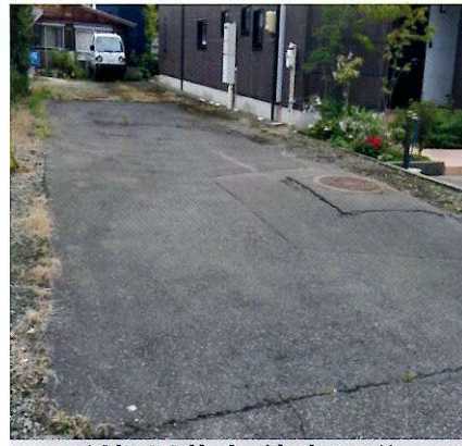
利根川花火 徒歩15分 5,000円/1台