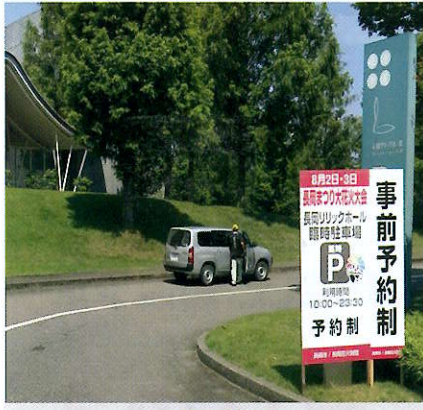
長岡花火 公式駐車場