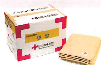
被災者配布用毛布 1人分