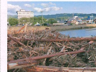
令和6年能登半島大雨災害(輪島市)